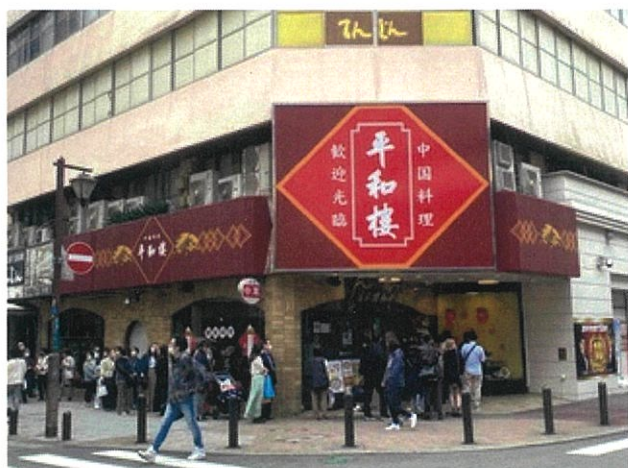
ご挨拶が終わり外に出ると、お店の外はすごい行列!!

1時間ほど今までの平和楼の歩みや父との思い出などを聞かせていただき、最後は握手でお別れしました。