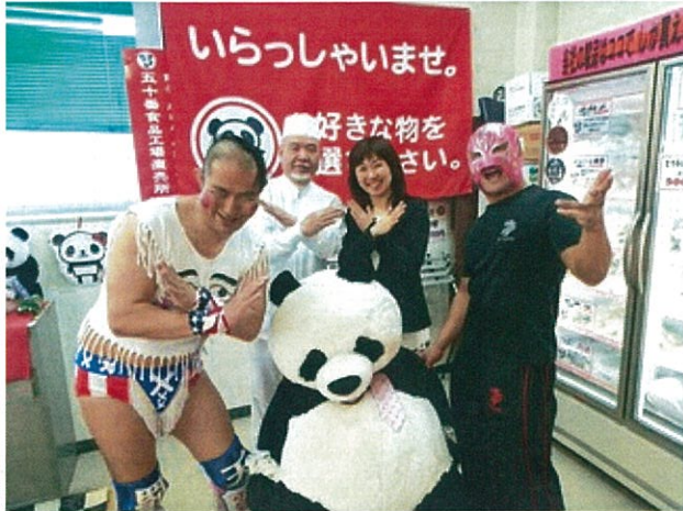
↑ 左がばってんぶらぶらさん、右がめんたいキッドさん。

今度7月7日に福岡国際センターで10周年の記念試合が行われるのですが、そのPR動画を撮るためにばってんぶらぶらさんとめんたいキッドさんが先日会社に来られました🐼🌸